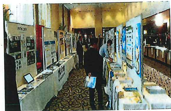
(R元年度秋季評議員会・臨時総会：四日市市開催)

注記：展示スペースは、長机一つ分を1団体分としていますが、パンフレット種類数、パネル枚数に応じて対応いたします。